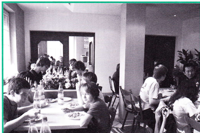
Optimal wurden die Teilnehmer im Bistro des LLZ verpflegt