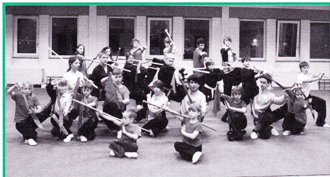
Training mit dem Säbel und Langstock