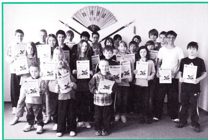
Zum Abschluss gab es auch zur Freude der Jugendlichen Urkunden